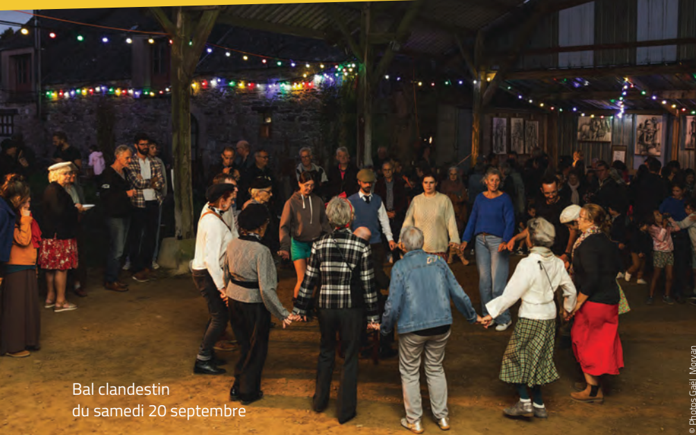
Bal clandestin du samedi 20 septembre