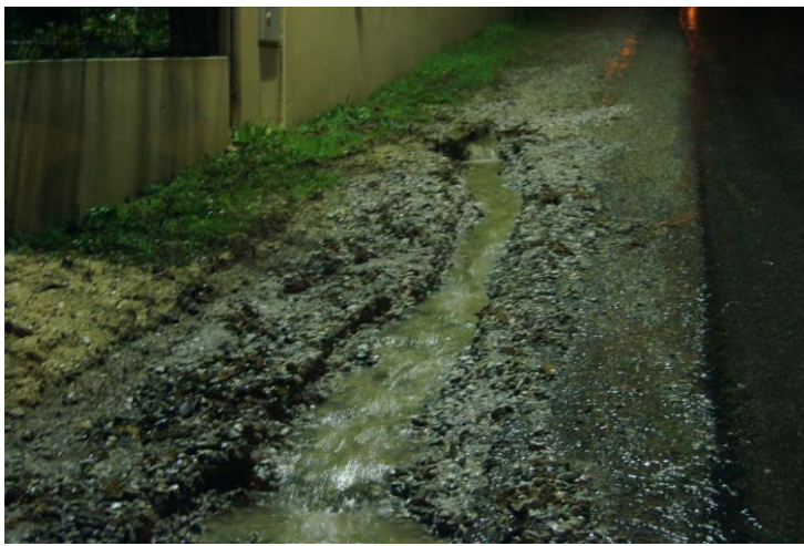
Sortie du regard amont