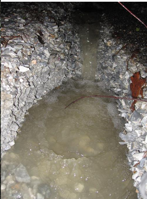
Vue de l'aval et trou creusé par l'eau